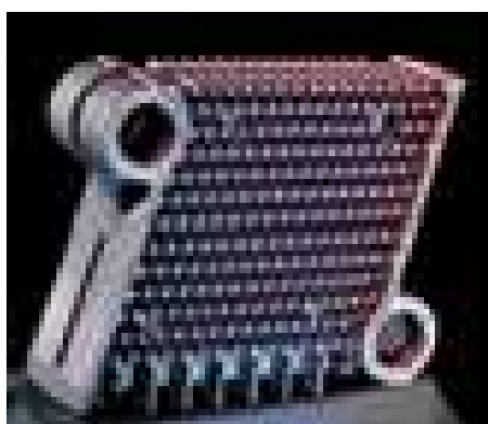
Поверхность нагрева из специального серого чугуна с ламельным графитом