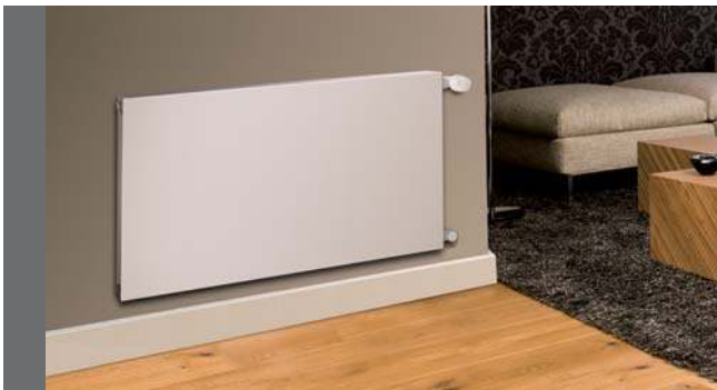
Plan Ventil Compact