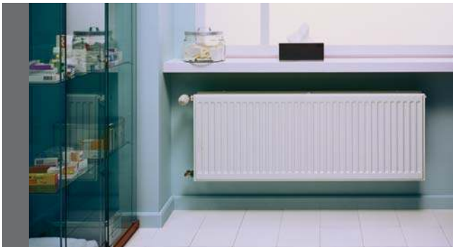
Purmo Ventil Hygiene