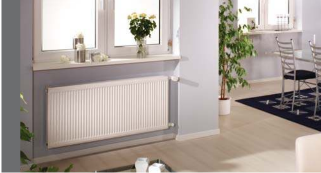
Purmo Ventil Compact