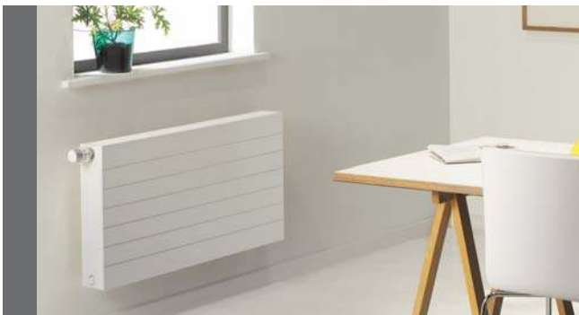
Ramo Ventil Compact